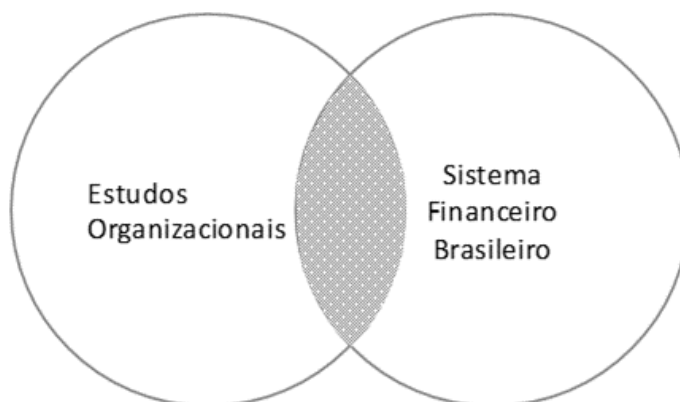
Figura 1: Mapa conceitual da área em estudo e sua intersecção.

O mapa conceitual da Figura 1 define a área de estudo deste trabalho, compreendida na intersecção dos temas Estudos Organizacionais e Sistema Financeiro Brasileiro.