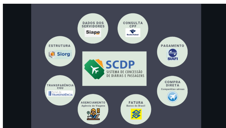
Figura 1 - Sistemas integrados ao SCDP

Administração de Pessoal (SIAPE)), permitindo a rápida obtenção de informações e evitando redundâncias e inconsistência de dados.