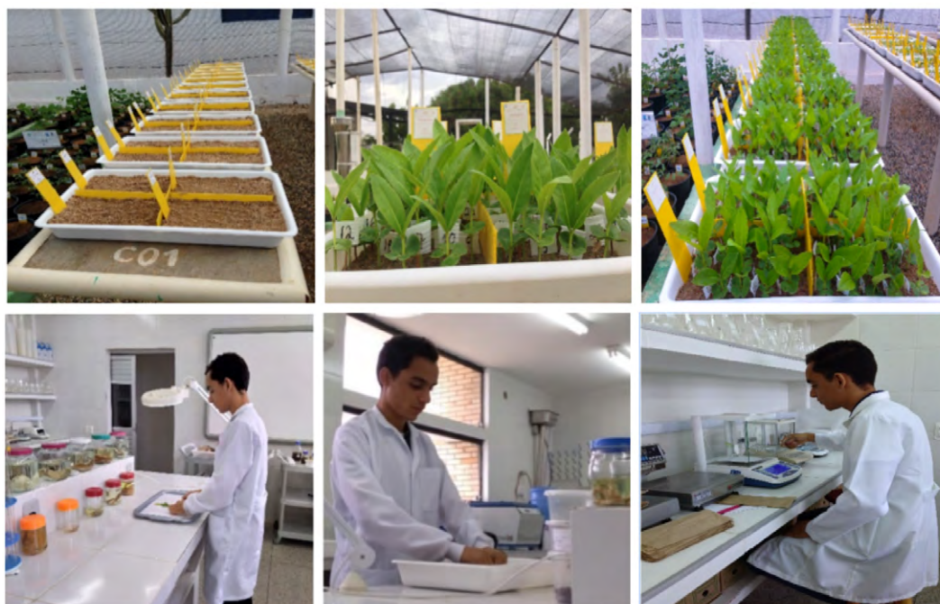
Figura 2 – Procedimentos de avaliação com T. aurea em viveiro e no Laboratório de Ecologia e Botânica (LAEB/UFPG/CDSA).

Trinta dias após o procedimento de semeadura, as plântulas de T. aurea foram avaliadas considerando o diâmetro ao nível do substrato com auxílio de um paquímetro digital de precisão 0,01 mm, comprimento de plântula (parte aérea e raiz), com a utilização de régua graduada. Os resultados de diâmetro e comprimento de plântula foram expressados em mm e cm, na respectiva ordem. Em seguida, os indivíduos foram submetidos à pesagem, sendo utilizado para isso a balança de 0,0001 g de precisão para determinar a massa fresca e, na sequência, foram levados à estufa com secagem programada a 105 °C durante o período de 24 h. Posteriormente, pesou-se novamente para a obtenção da massa seca. Os dados obtidos foram expressos em g por plântula. A Figura 2 (próxima página) faz referência às etapas das avaliações de T. aurea conduzidas em viveiro e em laboratório.