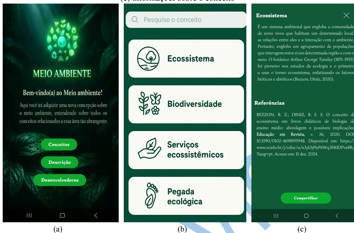
Figura 2 – Telas do aplicativo Meio Ambiente: (a) boas-vindas, (b) seleção de conceitos ambientais, (c) informações sobre o conceito