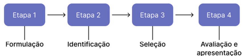
Figura 1 – Número de trabalhos retornados nas quatro etapas

A Figura 1 ilustra o processo metodológico estabelecido para esta pesquisa.