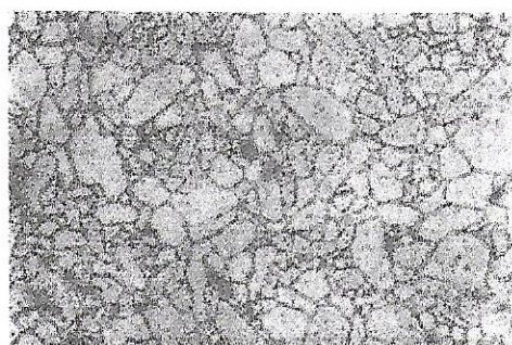
FIGURA 3 – AMOSTRA DE ALUMINA APÓS ATAQUE TÉRMICO EM 1500 0 C/30MIN.