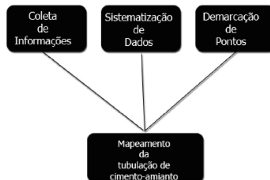
Figura 1. Fluxograma da metodologia.

A metodologia utilizada está representada no fluxograma exposto na Figura 1.