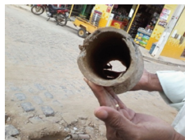
Figura 4. Estado de conservação da tubulação de cimento-amianto.

Todos os componentes das tubulações da rede de distribuição de água devem possuir resistência adequada para suportar as pressões internas estáticas e dinâmicas, geradas por transitórios hidráulicos operacionais, e as pressões externas, provocadas pelo peso do solo sobre os tubos e pela carga de veículos na superfície do terreno (FURUSAWA, 2011). Na Figura 4, pode ser observado o desgaste da tubulação, provavelmente provocado pela pressão dos veículos terrestres.