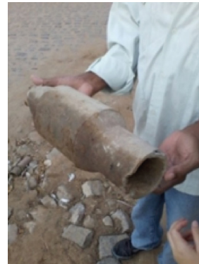
Figura 3. Registro fotográfico da canalização de cimento-amianto.

Avaliando a Figura 3, percebe-se que, com o desgaste do asfalto, a tubulação de cimento-amianto ficou exposta e foi danificada pelo fluxo de transportes. Isso pode ocasionar problemas ao fornecimento de água, pois podem ocorrer infiltrações de produtos químicos, óleos de veículos, poeiras e resíduos sólidos na rede de distribuição.