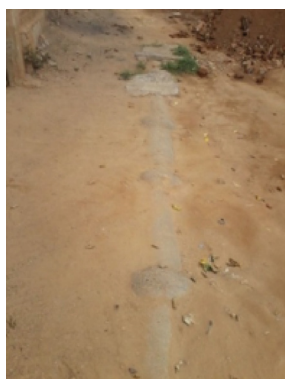
Figura 5. Tubulação de cimento-amianto exposta na superfície do terreno.

Na Figura 5 pode ser visualizada a tubulação de cimento-amianto exposta na superfície do terreno, sem sinalização ou proteção, podendo sofrer desgastes externos que viriam a prejudicar o fornecimento constante de água à população.