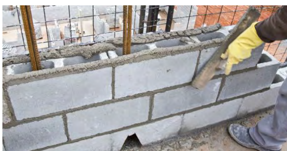
Figura 3 – Execução de parede de alvenaria estrutural com blocos de concreto