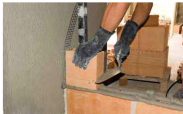
Figura 2 – Assentamento de blocos cerâmicos