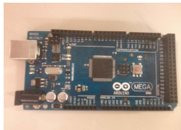
Figura 1 – Arduino Mega

O motor de passo, ilustrado na Figura 2, foi utilizado para movimentar a célula fotovoltaica. Por meio da programação do arduino, pode-se controlar fatores tais como: ângulo de rotação, velocidade e a posição final do eixo.