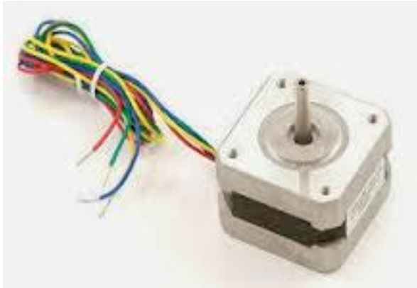
Figura 2 – Moto de Passo

Para a utilização do motor de passo, faz-se necessário o uso de uma ponte H, implementada pelo CI L293D, permitindo que o motor rode tanto para um sentido quanto para o outro. Isso permite que o painel retorne ao ponto de partida depois de acompanhar a trajetória do sol. Foram usados dois capacitores para filtrar a tensão, pois o capacitor tem a função de armazenar cargas elétricas quando liga uma fonte de tensão. O circuito montado encontra-se ilustrado na Figura 3, na qual se pode observar a plataforma Arduino MEGA ligada à ponte H e esta, ligada ao motor de passo.