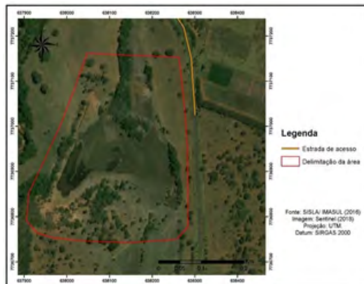
Figura 1 ► Localização da área de estudo.

O clima da região é do tipo Aw, com verão quente e úmido e inverno seco, com temperaturas amenas e precipitação pluviométrica anual entre 1200 mm e 1600 mm (ALVARES et al. , 2013), sendo os meses de novembro, dezembro e janeiro aqueles em que ocorrem precipitações máximas e os meses de julho, agosto e setembro os mais secos do ano. A temperatura média anual é de 24 °C, com máximas diárias de 36 °C durante a primavera e mínimas de 12 °C no inverno, sendo rara a ocorrência de geadas.