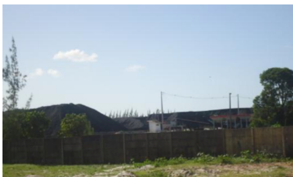
Figura 2 - Petcoke estocado em pilhas a céu aberto)

O produto fica estocado em pilhas a céu aberto (Figura 2), sendo facilmente dispersado pela ação dos ventos e depositado sobre a vegetação do mangue, causando danos ambientais a esse ecossistema, bem como provocando problemas de saúde na comunidade em seu entorno. Entre os problemas provocados pelo petcoke podem-se citar problemas respiratórios e alergias de pele (CAMARGO et al. , 2013).