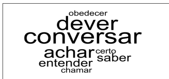
Figura 2 – Análise lexical por meio da Nuvem de Palavras acerca da questão “Como os pais deveriam agir quando os adolescentes não fazem o que eles pedem?”

Ao se utilizar o software IRaMuTeQ para analisar as respostas à pergunta “Como os pais deveriam agir quando os adolescentes não fazem o que eles pedem?”, foi possível encontrar na Nuvem de Palavras, de forma preponderante, a palavra “Conversar”, seguida por “Dever” e “Achar”, como se pode observar na Figura 2.