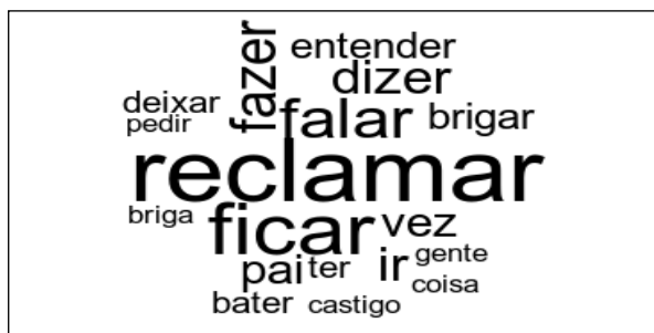
Figura 1 – Análise lexical por meio da Nuvem de Palavras acerca da questão “Como seus pais agem quando você não faz o que eles pedem?”

agem quando você não faz o que eles pedem?”, é possível observar na Figura 1 que, no corpus do texto, a palavra “reclamar” apareceu com maior frequência, corroborando os achados da análise de conteúdo bardiniana dessa mesma questão.