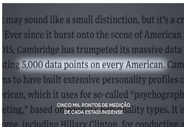
Figura 2 – Uso de dados dos usuários do Facebook, sem consentimento, pela Cambridge Analytica

“é bom que o campus faça palestras para nos ajudar a orientação de perigos que existem nas redes”. Como exemplo de perigo das redes sociais, apresenta-se o uso de dados por instituições de propaganda, no Facebook, sem que haja autorização dos usuários, como ocorreu nas eleições de 2016 nos Estados Unidos, por intermédio da empresa Cambridge Analytica (PRIVACIDADE..., 2019). Diante disso, a orientação sobre o cuidado com o uso de aplicativos, já que estes podem servir de plataforma para que os dados dos usuários sejam subtraídos, pode ser uma ação da instituição escolar.