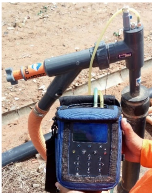
Figura 3 – Cabeçote do dreno horizontal conectado ao leitor de gás GEM5000

A extremidade lisa atravessa a camada de cobertura e se conecta a um cabeçote. Esse cabeçote possui 3 conectores (do tipo engate rápido) nas exatas especificações do leitor de gás GEM5000, exibido na Figura 3.