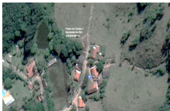
Figura 1 – Mapa da nascente do Rio Jundiá-Mirim (p1), bairro Nova Odessa, Jundiá/SP

O ponto amostral 1 (p1) localiza-se no bairro Nova Odessa, próximo à Avenida Humberto Cereser, dentro de uma propriedade particular rural (Figura 1). A entrada na propriedade foi realizada com o consentimento verbal dos moradores. Neste ponto foi possível observar uma vasta área de bambuzal, bem como atividade agropecuária nas imediações. Em relação ao aspecto geral da amostra, esta apresentava uma perceptível turbidez (Figura 2).