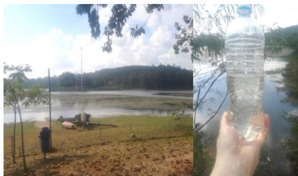
Figura 4 – Ponto de coleta 2 (p2) e amostra coletada