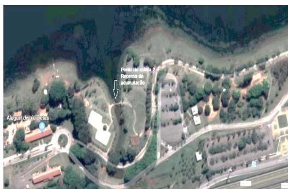
Figura 3 – Mapa da represa de acumulação (p2), localizada no Parque da Cidade, Jundiá/SP

O ponto amostral 2 (p2) encontra-se no Parque da Cidade de Jundiá, que recebe em média 7 mil pessoas por semana (PREFEITURA DE JUNDIAÍ, 2019) e possui uma represa de acumulação com capacidade para 8 bilhões de litros de água (PORTAL TRATAMENTO DE ÁGUA, 2018) (Figura 3). Neste ponto de coleta, apesar de completamente antropizado, foi possível observar a existência de mata ciliar, espuma, material sedimentar e peixes, bem como diversas capivaras no entorno da represa; apesar disso, o aspecto geral da amostra estava bom no tocante à turbidez (Figura 4).