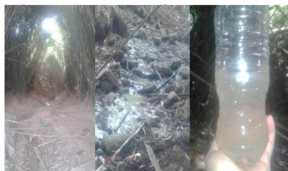
Figura 2 – Ponto de coleta 1 (p1) e amostra coletada