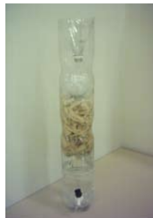
Figura 1. Vinagreira confeccionada com garrafas PET.

Na elaboração da vinagreira (Figura 1) foram utilizadas as garrafas PET coletadas nos centros de reciclagem de plástico da cidade de João Pessoa-PB, Brasil. A vinagreira foi desenvolvida de acordo com o fluxograma 1.