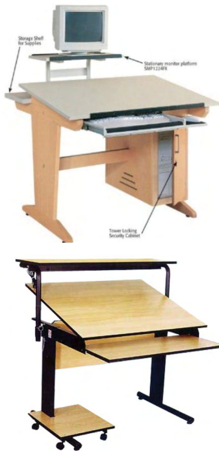
Figura 7. Pranchetas profissionais com espaço para o desenho tradicional e o computador.

trabalhos em escritórios de projetos de arquitetura ou de engenharia e em nossa opinião, não se adequam bem para o uso em sala de aula, pois, não permitem boa flexibilidade, são de dimensão exagerada e pesadas e se assemelham bastante às tradicionais pranchetas de desenho, portanto, não se adequam ao uso em salas de aula com proposta renovadora.