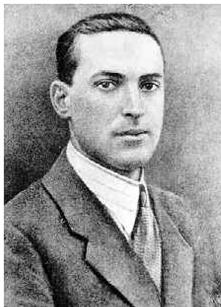
Figura 4. Lev Semenovich Vygotsky.

Lev Semenovich Vygotsky (Figura 4) nasceu em 1896 na cidade de Orsha, na Rússia, e morreu em Moscou em 1934, com apenas 38 anos. Formou-se em Direito, História e Filosofia nas Universidades de Moscou e A. L. Shanyavskii, respectivamente.