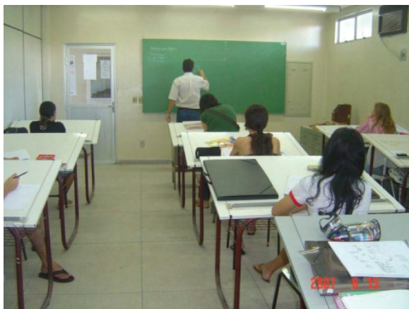
Figura 2. Professor em atividade em uma sala de desenho tradicional.

Geralmente o professor explica a tarefa em quadro negro ou branco e o aluno realiza a tarefa individualmente conforme a Fig. (2), sendo este aluno avaliado através da qualidade de seu traço, limpeza do desenho, capacidade de leitura e interpretação do desenho técnico, aplicação das normas técnicas entre outros itens de avaliação.