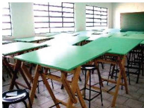
Figura 1. Sala de aula de desenho tradicional.

Como podemos observar na Fig. (1), a sala de desenho dita tradicional é caracterizada por pranchetas de desenho enfileiradas onde o aluno freqüentemente realiza suas tarefas sentado em um banco alto ou em uma cadeira, onde dispõe de instrumentos de desenho como lápis ou canetas, régua paralela, esquadros, escalas, compassos e executa o desenho proposto pelo professor em uma folha de papel denominada de prancha, ou formato de papel.