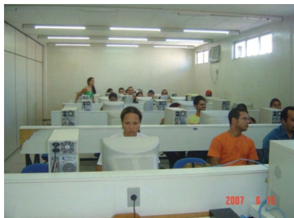
Figura 3. Sala de informática utilizada para o ensino do CAD.

Já no ensino do desenho auxiliado por computador, o aluno assiste aula em uma sala de informática com os computadores dispostos em bancadas, geralmente enfileiradas (Figura 3) ou em outro tipo de arranjo físico. O professor então ensina os comandos básicos do programa estudado e o aluno executa-os diretamente na tela do computador através do mouse e do teclado alfa-numérico.