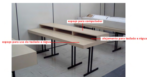
Figura 9. Estação de trabalho proposta.

Para essa pesquisa optamos por uma nova proposta de estação de trabalho, baseada em uma bancada de informática, que possuísse espaço suficiente para que três alunos possam trabalhar por estação, incentivando assim, o trabalho em equipe. Além disso, essa proposta possibilita o rearranjo da sala de desenho conforme estudo de layout prévio. A estação proposta possui espaço para colocação do computador e teclado, além dos instrumentos de desenho, como régua paralela e esquadros, conforme podemos ver na Fig. (9).