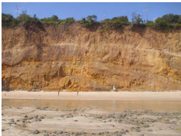
Figura 1. Vista parcial do paredão da Falésia do Cabo Branco (Formação Barreiras), João Pessoa – PB.

mente em cápsulas de porcelana. Utilizou-se lupa binocular estereoscópica (aumento 20x40x80x) para a visualização da morfometria dos grãos em escala aumentada, componentes sedimentológicos de cada estrato e textura, além de inferir interpretações sobre a origem da deposição daqueles sedimentos (ALMEIDA, 2008; FÁVERA, 2001).