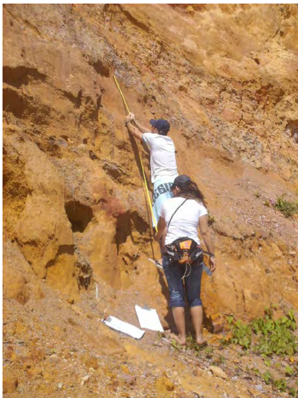
Figura 2. Identificação, medição dos estratos e coleta de material sedimentológico na Falésia do Cabo Branco, João Pessoa - PB.