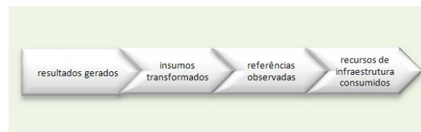
Figura 01 – Papéis dos valores do processo

Nesse sentido, a gestão de processos não é pensada com foco no problema, mas na solução. A lógica dessa proposta pode ser representada conforme Figura 01.