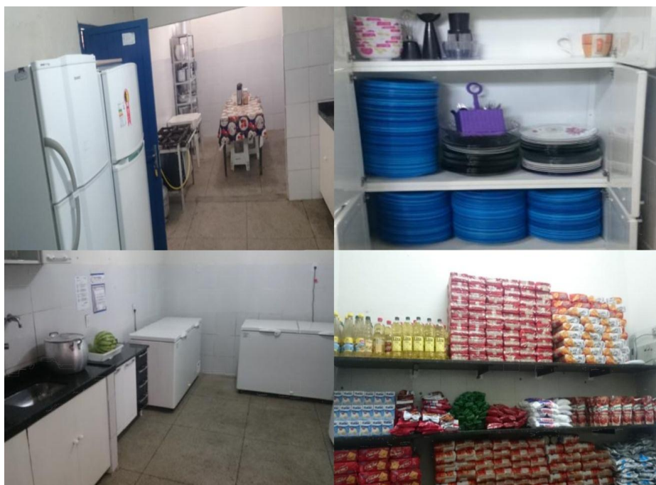
Figura 3 - Conformidades dos itens de avaliação após treinamento dos profissionais responsáveis pela produção da merenda escolar.

A cartilha educativa com informações sobre as condições adequadas do armazenamento da merenda escolar estadual e as boas práticas higiênico-sanitárias foi confeccionada e entregue na escola onde se aplicou o trabalho para que todos os funcionários possam consultar e cumprir as medidas essenciais para garantir a produção de alimentos seguros e saudáveis (FIGURA 4).