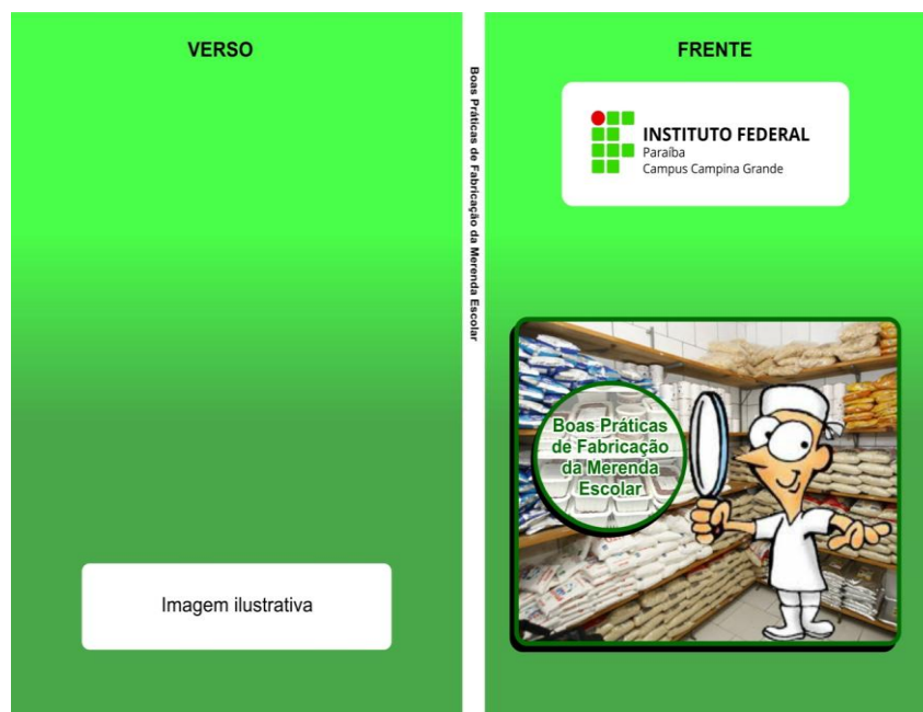
Figura 4 – Cartilha educativa sobre as boas práticas de fabricação da merenda escolar.