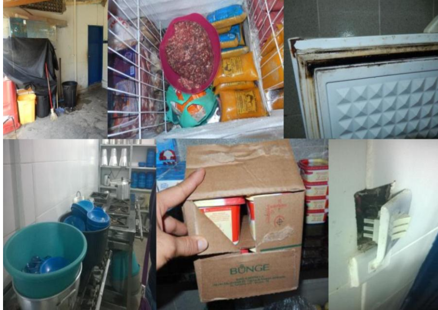
Figura 2 - Não conformidades dos itens de avaliação quanto ao atendimento às Boas Práticas de Fabricação.

Na Figura 2 estão apresentados os registros das não conformidades verificadas na avaliação dos itens a partir da aplicação do checklist .