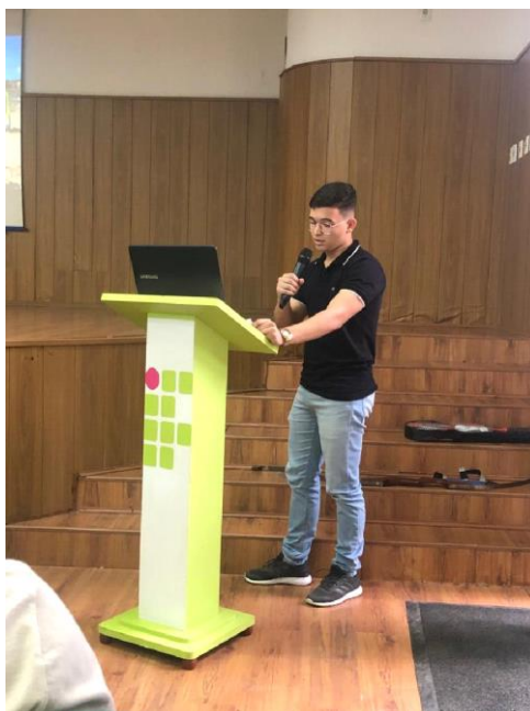
Figura 6 - Apresentação dos projetos do núcleo maker no auditório do IFPB - Campus Cajazeiras