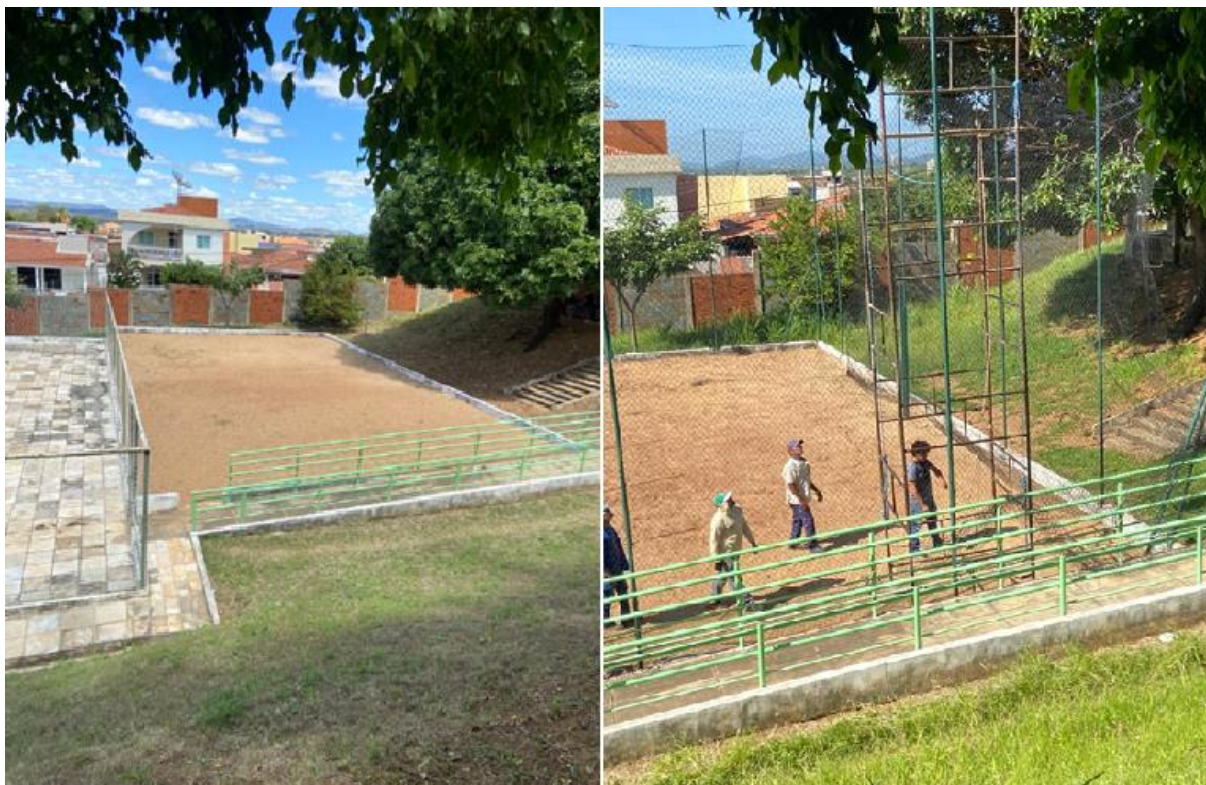
Figura 5 – Local de prática de Beach Tennis antes (esquerda) e depois (direita)