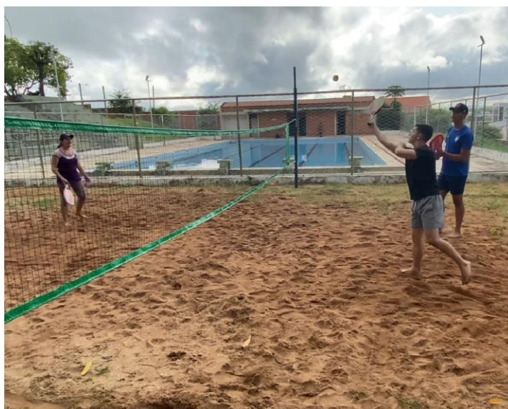
Figura 7 - Início das práticas no IFPB - Campus Cajazeiras