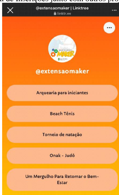
Figura 3 - Portal de Inscrições junto com outros projetos de extensão