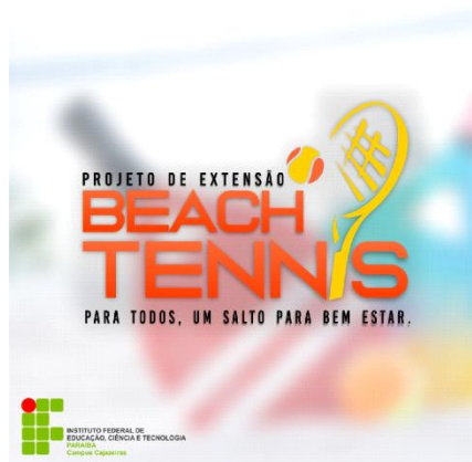
Figura 1- Logomarca do projeto

Nesse contexto, o projeto de Beach Tennis surge como uma iniciativa relevante e necessária. O objetivo é proporcionar aos discentes acessos a essa modalidade esportiva, utilizando as instalações do IFPB - Campus Cajazeiras, que oferecem um ambiente adequado para a prática. Acredita-se que essa inclusão não só promoverá a saúde individual, mas também fortalecerá a comunidade e melhorará a qualidade de vida da população brasileira. Além disso, o crescimento do Beach Tennis representa um cenário positivo para a economia, movimentando o mercado de produtos esportivos e incentivando o desenvolvimento contínuo dessa modalidade no país. Portanto, investir nesse estudo é uma escolha estratégica e benéfica para todos os envolvidos. A figura 1 abaixo mostra a logo do projeto desenvolvida com a finalidade de divulgar a iniciativa entre a comunidade.