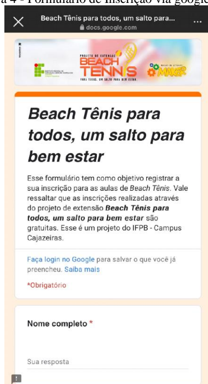
Figura 4 - Formulário de Inscrição via google forms