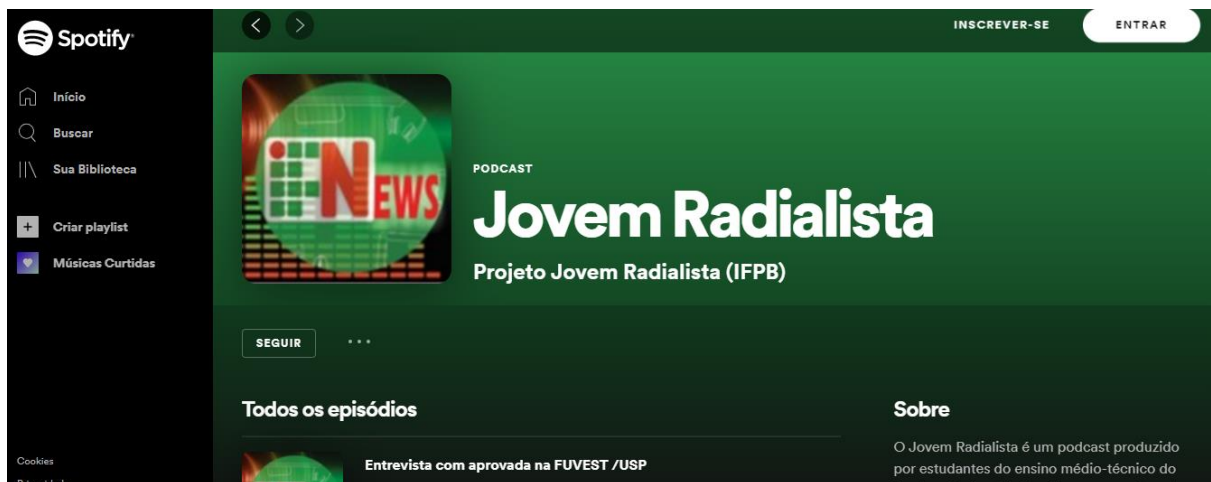
Imagens do Projeto Jovem Radialista na plataforma Spotify