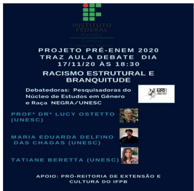
Figura 1: cartaz de divulgação da aula inaugural Pré-Enem.

O objetivo dessa aula debate foi discutir historicamente o racismo estrutural, tema que aflorou no ano de 2020, mas que, sabemos, tem raízes profundas na sociedade brasileira. Mais do que informar e preparar para a prova do ENEM, a aula pretendeu discutir com os alunos as origens e mazelas do racismo e como todos nós podemos nos tornar antirracistas.