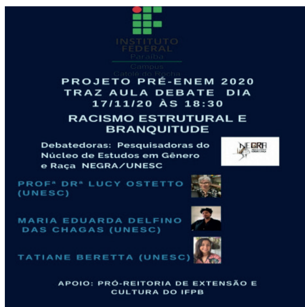
Figura 1: cartaz de divulgação da aula inaugural Pré-Enem.

O objetivo dessa aula debate foi discutir historicamente o racismo estrutural, tema que aflorou no ano de 2020, mas que, sabemos, tem raízes profundas na sociedade brasileira. Mais do que informar e preparar para a prova do ENEM, a aula pretendeu discutir com os alunos as origens e mazelas do racismo e como todos nós podemos nos tornar antirracistas.