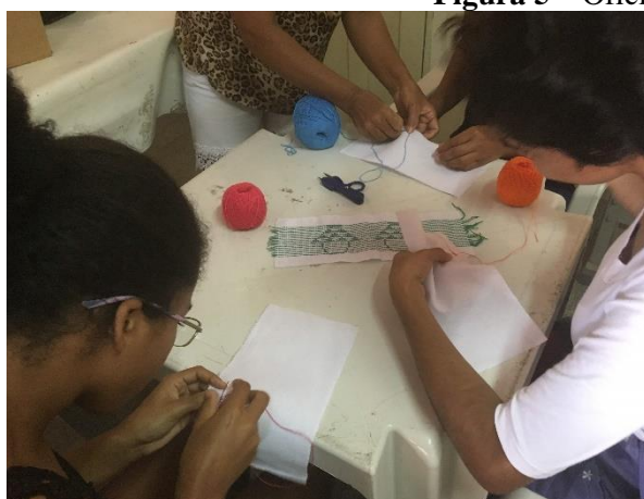
Figura 5 – Oficinas de artesanato