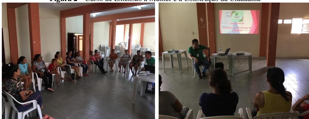
Figura 2 – Curso de Extensão a Mulher e a Construção da Cidadania

O presente Programa de Extensão foi desenvolvido de forma satisfatória, onde verificou-se um desenvolvimento entre as participantes, tanto do ponto de vista dos conteúdos abordados nos Cursos de Extensão, quanto nas Oficinas de Artesanato. A seguir, são apresentadas algumas imagens de ações realizadas.