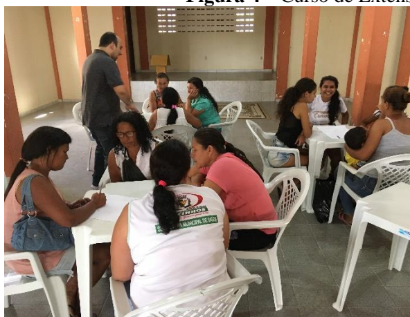
Figura 4 – Curso de Extensão Modelagem de Negócios