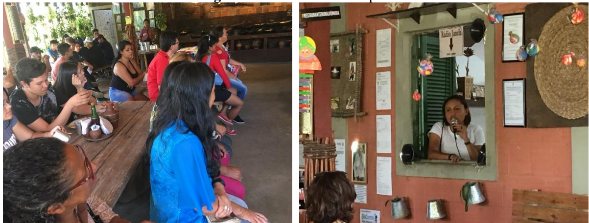
Figura 6 – Atividade de campo