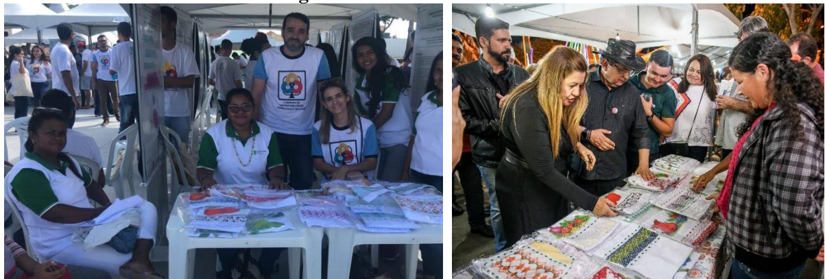
Figura 7 – Atividade de vendas