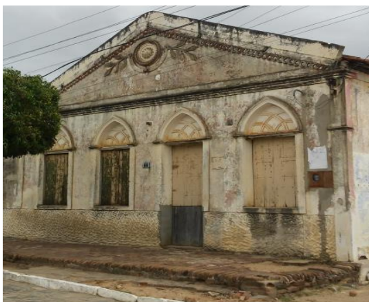
Figura 10 – Vista da fachada frontal da residência da rua Dr. André Bezerra