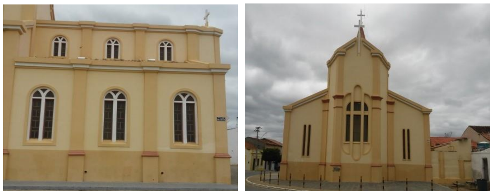
Figuras 1 e 2 – Vista lateral e frontal da antiga capela, 2017

Uma das principais construções do objeto de estudo é a igreja católica matriz, localizada no coração da cidade, é a construção de pedra e argamassa mais alta da cidade, sua datação é imprecisa, graças a falta de documentação da época, contudo, pode-se basear pelos registros históricos, que a mesma possui cerca de 150 anos, embora sua construção tenha sido dividida em duas fases, a primeira foi a capela, onde hoje se localiza na parte de traz da construção, a segunda fase é a construção da torre, esta foi iniciada em 1946 (RIETVELTD, 1999). [Ver figuras 1 e 2].