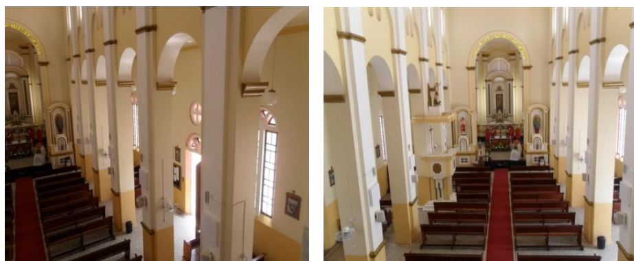
Figuras 4 e 5 – Vista do interior da igreja matriz, 2017

O interior dessa construção é uma fusão de estilos, unindo o barroco, que está nítido pela riqueza de detalhes e do maneirismo, pela geometria assimétrica em suas peças estruturais e ornamentais, como visto na figura 4 e 5. Um detalhe a ser frisado nessa imagem é a quantidade de pilares de sustentação, ao todo são 12, representando a quantidade de apóstolos de Jesus Cristo, isso foi uma exigência do sacerdote que a projetou.