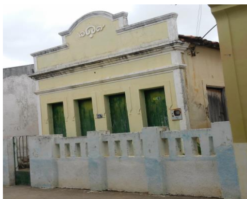
Figura 9 – Edifício da Rua Artur Costa Leitão

Sua datação, como as demais, é imprecisa, pois como em todas as construções antigas, a documentação era um artigo raro de se conseguir, dessa forma, dificulta a sua exatidão. Sua fachada possui detalhes na parte superior e atualmente não está passando por manutenção de nenhum tipo, uma vez que não está sendo residida, como está representado na figura 9, destacam-se as nuances do estilo de sua fachada.