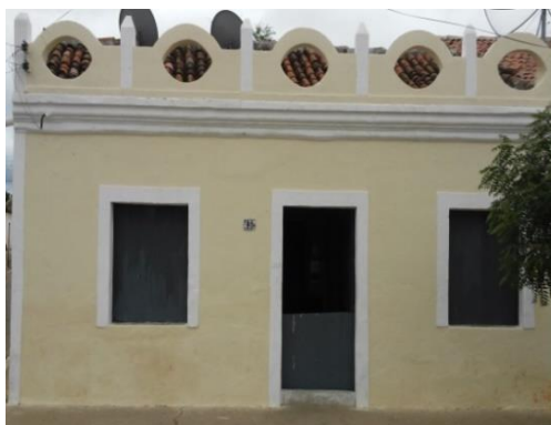
Figura 6 – Fachada da primeira casa do município, 2017

Toda a sua fachada, no que concerne ao modelo, é original, assim como a arquitetura interior, totalmente compreendida nos moldes da segunda metade do século XVIII.