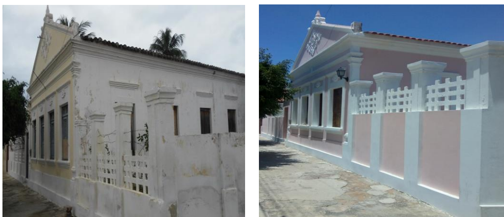
Figuras 7 e 8 – Antes e depois da reforma do terceiro bem estudado

Nos últimos anos, os descendentes aos quais ela pertencia, a venderam, o novo proprietário proporcionou uma reforma quase que completa, revitalizando-a, efetuando manutenções de características tanto corretivas quanto preventivas, deixando sua fachada intocada no que se refere a sua integridade [Ver figuras 7 e 8].