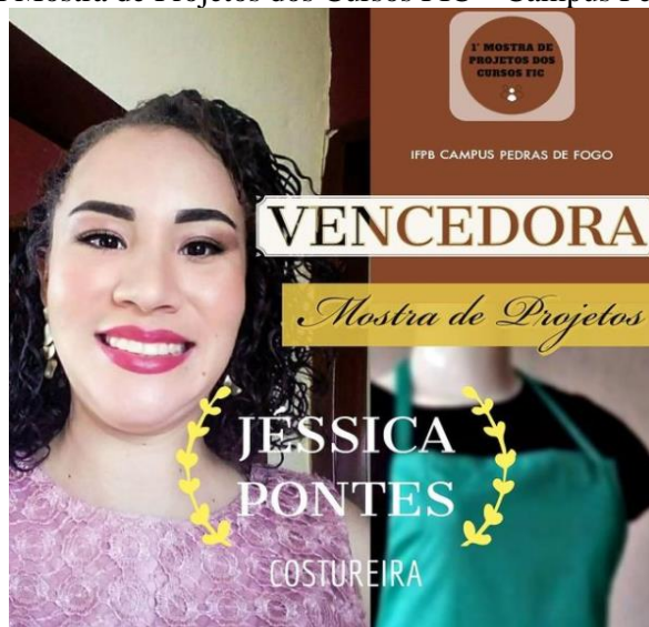
Figura 5 - Vencedora da I Mostra de Projetos dos Cursos FIC – Campus Pedras de Fogo