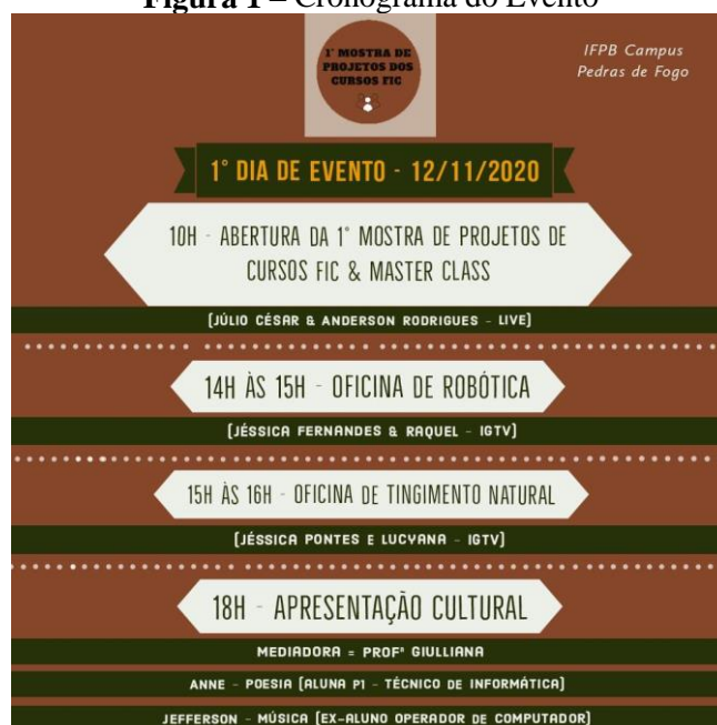
Figura 1 – Cronograma do Evento