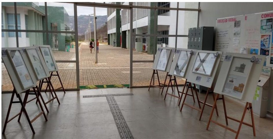
Imagem 5 - Exposição dos trabalhos produzidos pelos alunos durante o curso de extensão