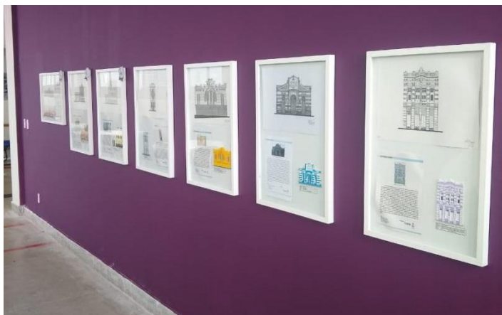
Imagem 6 - Exposição permanente na Biblioteca do IFPB - Campus Princesa Isabel