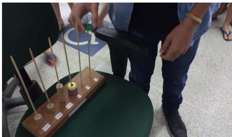
Figura 3 - Execução da atividade por aluno

Ao decorrer do jogo a dificuldade foi aumentando de acordo com que os alunos fossem acertando, sendo a primeira parte feita com três discos, a segunda com 4 discos (Figura 3) e a terceira com 5 discos. Durante a execução da atividade, os alunos fizeram uma espécie de competição a fim de descobrir qual seria o primeiro grupo a conseguir solucionar o enigma.