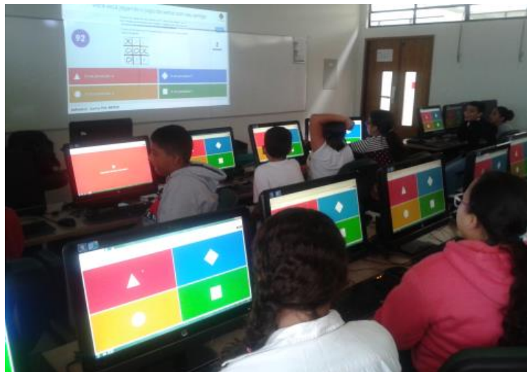
Figura 4. Aplicação do Kahoot

realizadas diversas atividades com a utilização da plataforma durante a duração do projeto, utilizando o seu recurso Quiz (figura 4). O professor responsável pela classe criou uma sala online no aplicativo através do seu notebook e compartilhou um pin (sequência de números) com os alunos, utilizando este pin os alunos acessaram a sala virtual através dos computadores do laboratório de informática onde eram realizadas as aulas.