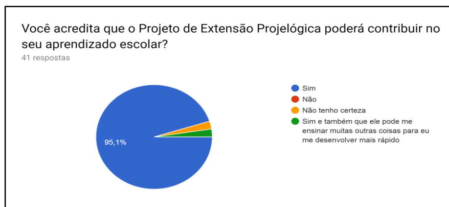
Figura 5 – Gráfico de contribuição do projeto na vida acadêmica

Nesse contexto é perceptível que o processo de gamificação auxilia de forma a aumentar o engajamento dos alunos e os influenciam a estudar de forma mais dinâmica. A junção de elementos de jogos no processo de educação fez com que os indivíduos se interessassem mais pelas matérias propostas os incentivando a continuar estudando matérias que até então não eram de fácil entendimento. Os alunos também opinaram em relação ao impacto do projeto de extensão quanto ao seu desenvolvimento do aprendizado escolar, cujo os dados foram obtidos através de um formulário, semelhante ao realizado durante a inscrição e respondido no período final do projeto apresentando dados satisfatórios como mostra a Figura 5.