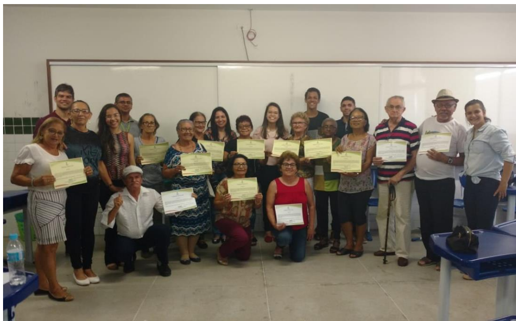
Figura 3 – Momento da entrega do certificado de conclusão do curso