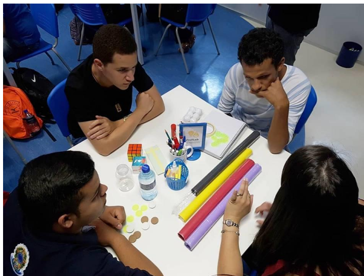
Figura 2 – Momento da formação