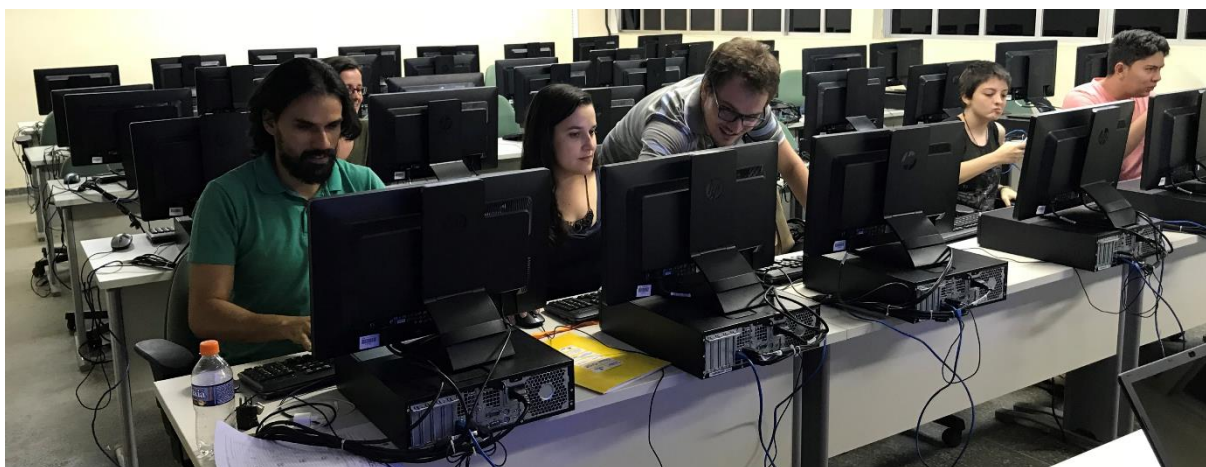
Figura 2 – Registro da equipe em rotina de trabalho de cooperação