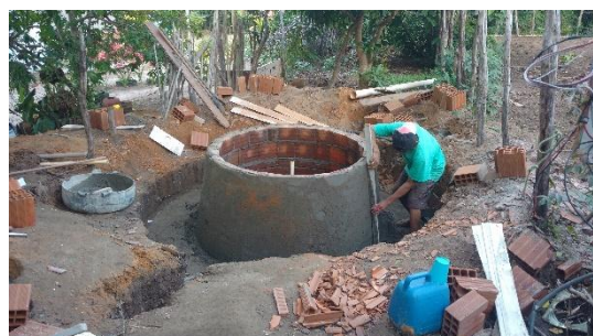
Figura 3 – Mosaico de imagens da estrutura do biodigestor sendo montada.

Acabamento Final – O acabamento do Biodigestor foi finalizado atendendo todos os critérios estabelecidos para um no modelo indiano com selo d'água, conforme Figura 3.