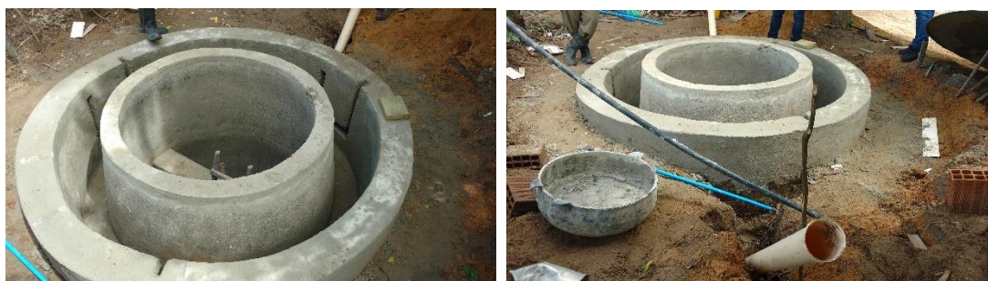
Figura 4 – Mosaico de imagens do biodigestor finalizado em Santa Rita – PB.

Após a construção do Biodigestor na cidade de Lucena, a Tecnologia Social foi replicada, utilizando o mesmo modelo, na região periurbana do município de Santa Rita - PB, visando mitigar poluentes advindos de criações suínícolas próxima ao Rio Tibiri, conforme Figura 4.