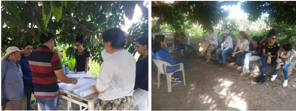
Figura 2 – Mosaico de imagens do minicurso sobre necessidades e dimensionamento de biodigestores.

Em seguida, através do fomento aprovado no Edital de Extensão nº 01/2017 - PROBEXC PROJETO foi possível a construção do primeiro biodigestor piloto, construído onde ocorreu o treinamento no sítio do Sr Dede, um produtor orgânico com o perfil para recebimento do equipamento, tornando possível viabilizar a primeira unidade demonstrativa que serviu de modelo para outros Biodigestores.