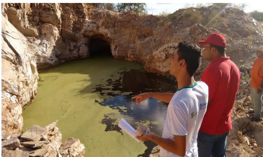
Figura 2 – Garimpo Xique-Xique - Carnaúba dos Dantas, RN.

Ao longo dos meses do projeto foram visitados e mapeados cerca de 11 garimpos compreendendo os municípios de Picuí e Carnaúba dos Dantas. Uma das unidades, localizada em Carnaúba dos Dantas foi incluída na pesquisa por conter, próximo à divisa entre as cidades, garimpos que absorvem trabalhadores do município de Picuí. É exibido, na figura 2, um dos garimpos visitados.