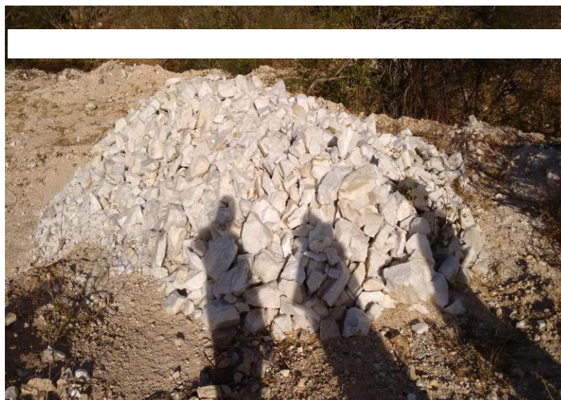
Figura 4 – Pilha de rejeito da atividade garimpeira – Quartzo.

Este último, em 100% dos garimpos visitados, foi observado como sendo o principal estéreo. Na maioria dos casos durante o processo de extração fragmentos com intrusões de outros elementos promoviam o descarte do material em um volume considerável.