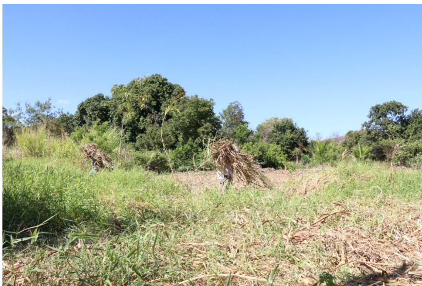
Figura 2 – Agricultor coletando capim-elefante para confecção do silo no Assentamento Padre Cleides.

Mesmo com essa avaliação da qualidade do capim foi sugerido a realização de uma oficina sobre ensilagem com aquele material. Para que além de manejara produção de capim se produzisse um vídeo sobre a experiência com estocagem. A ideia apresentada foi de produzir um vídeo didático/pedagógico que pudesse ajudar outras famílias, em outros lugares a fazerem também suas estocagens de forragem, inspiradas na experiência do assentamento Padre Cleides.