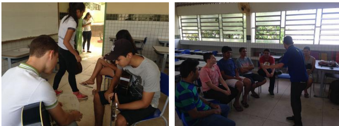
Figura 5 – Workshops na cidade de Araçagi.

A segunda cidade onde realizamos as metas do projeto foi Araçagi, cidade que fica a 10Km de Guarabira. O projeto foi desenvolvido na Escola Estadual de Ensino Fundamental e Médio Francisco Pessoa Brito no dia 23 de setembro de 2016.