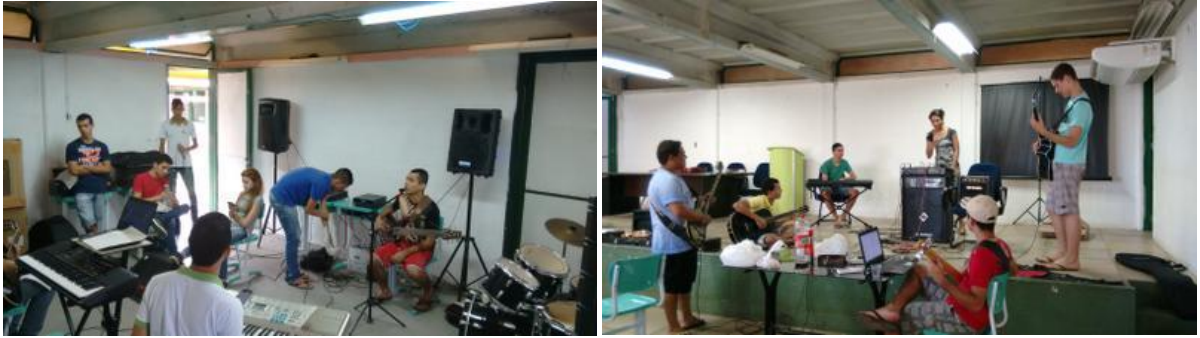
Figura 2 – Momentos de ensaios.

Já na terceira etapa foram realizadas as apresentações e workshops nas escolas públicas escolhidas e programadas. Quando o coordenador e o grupo perceberam que o repertório estava bem preparado, agendaram as datas e horários das apresentações nas escolas, ocorrendo 4 (quatro) apresentações musicais.