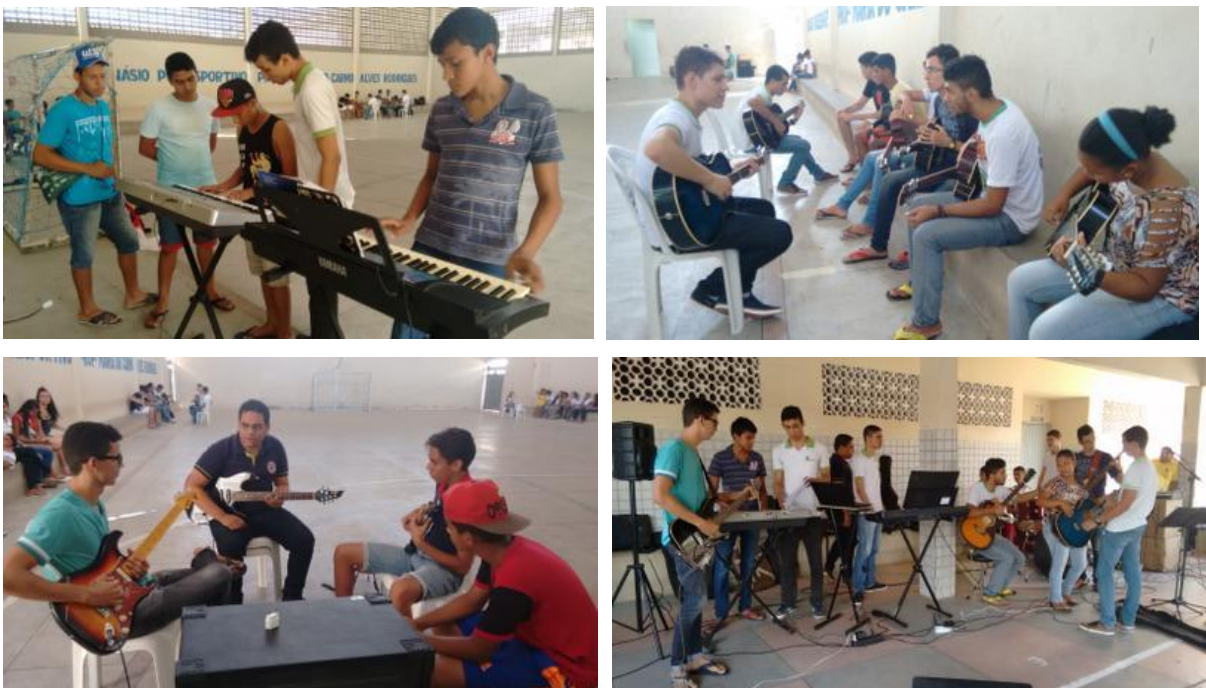
Figura 3– Workshops e apresentação musical na cidade de Belém. Fonte: foto Líbna Naftali, 2016

A primeira apresentação musical da banda, dentro deste projeto, juntamente com a realização dos workshops aconteceu na cidade de Belém, na Escola Estadual de Ensino Fundamental e Médio Engenheira Márcia Guedes, no dia 22 de agosto de 2016 no período da tarde, alunos desta instituição foram contemplados com workshops de voz, teclado, violão e guitarra e no fim participação na apresentação musical com a banda IFMusic. Belém fica a 23 KM de distância da cidade de Guarabira.