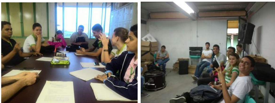
Figura 1– Reuniões de planejamento.

Todavia, esta foi uma discussão a ser feita no momento, cabendo ao grupo decidir sobre esta questão. Na segunda reunião elaboramos o cronograma com as datas possíveis para as apresentações e workshops nas escolas públicas.