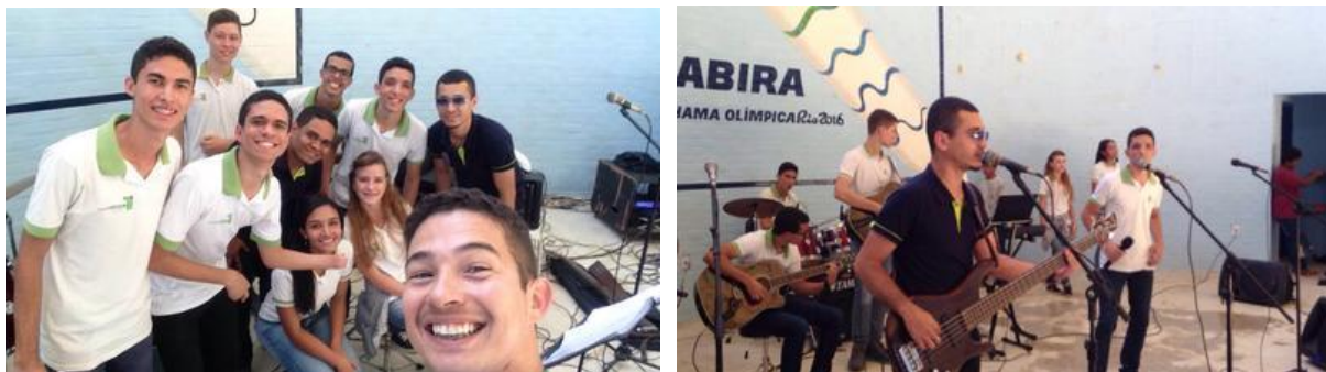
Figura 4 – Participação na Gincana Cultural das escolas municipais da cidade de Guarabira.

Na cidade de Guarabira, o projeto participou da Gincana Cultural das escolas municipais com uma apresentação musical no ginásio do CIEC – Centro Integrador de Educação, Esporte e Cultura, no dia 12 de agosto de 2016.