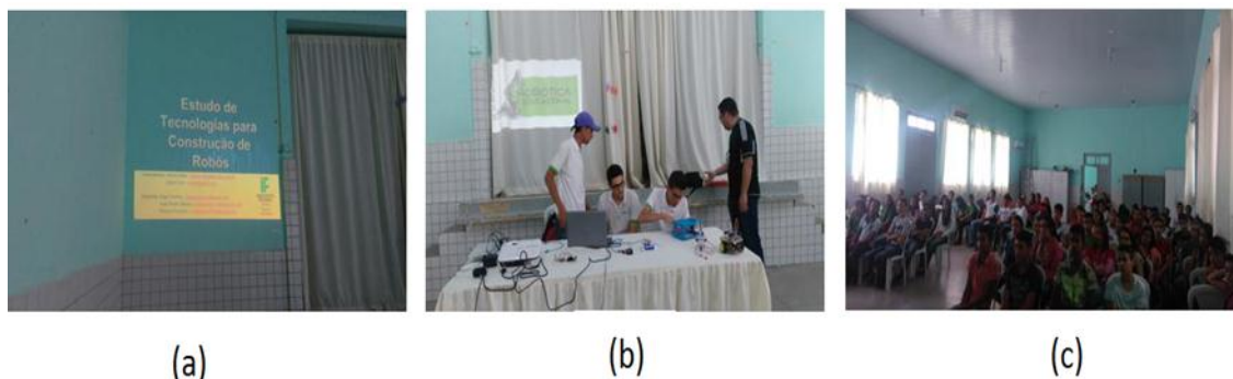
Figura 3 – Fotografia da apresentação da palestra dos alunos na escola pública municipal.

estimava-se cerca de 50 alunos, e, na realidade, estavam presentes 114 alunos e 8 professores (Figura 3-c).