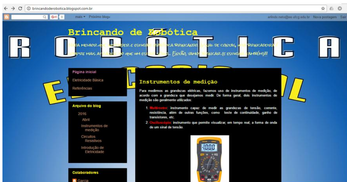
Figura 2 – Página principal do site Brincando de robótica.